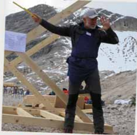
Bau-Trupp für den guten Zweck

Nachhaltigkeit. Perspektivenwechsel. Neue Aufgaben. Ihr Team stellt den Bautrupp, wir stellen die Idee und gemeinsam fertigen Sie Ihr Meisterstück an: ob Schutzhütte, Spielplatzelement, Hochsitz oder Wanderbrücke – wir suchen das passende Stück für Sie!